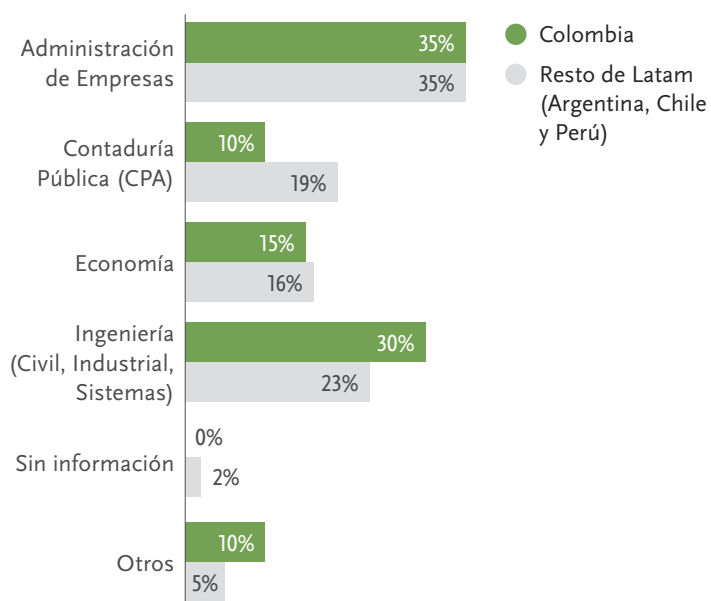
ESTUDIOS DE PREGRADO DE LOS CFOs EN COLOMBIA Y EL RESTO DE LATAM

Adicionalmente, el 90% de los CFOs del COLCAP tienen un título de postgrado. De estos, el 70% estudió en el extranjero (43% eligió universidades europeas y el resto estudió en los EEUU). Los que han realizado algún estudio de posgrado en Colombia, lo han hecho en las siguientes universidades: INALDE, Universidad Pontificia Bolivariana, Universidad de los Andes, Pontificia Universidad Javeriana de Cali y Universidad EAFIT.